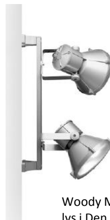
Woody Maxi sørger for lys i Den Grå Kødbby