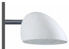
Cityswan ophænges på Facader på Flæsketorvet

Du skal dog forvente, at der få steder vil være små områder, hvor det er nødvendigt at afbryde eksisterende lyd for at kunne montere det nye.