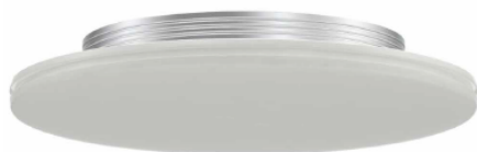
Til brug under baldakiner og i porte fremstilles helt ny armatur