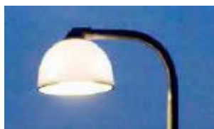
Københavnerlampen anvendes i Staldgade