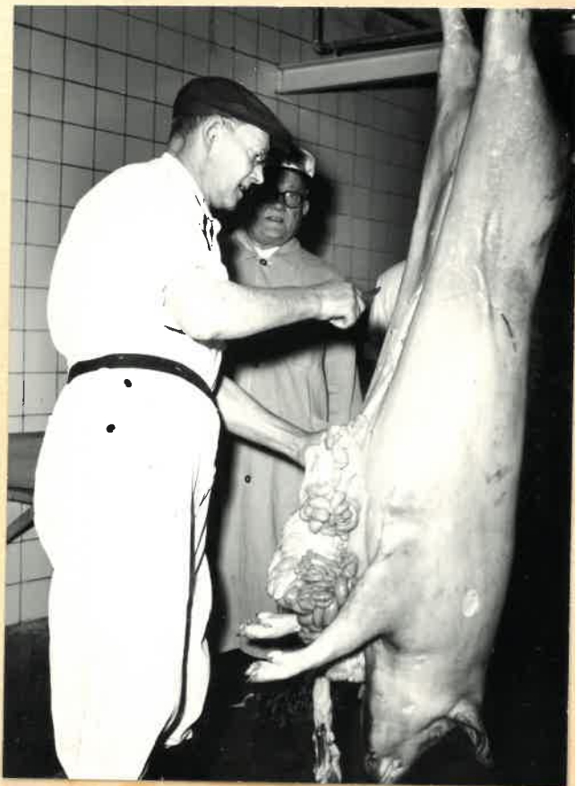
Klar til opskæring.