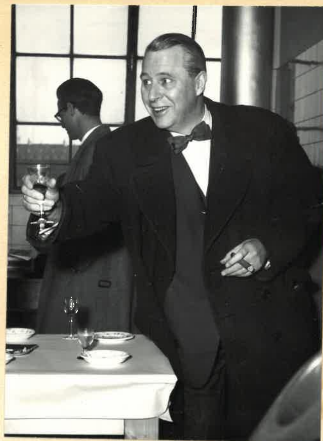
Borgmester O. Weikop