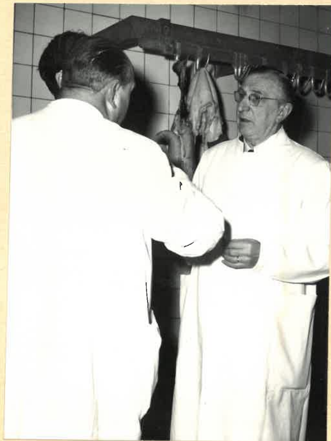
Ing. Østergaard og overdyrlæge.