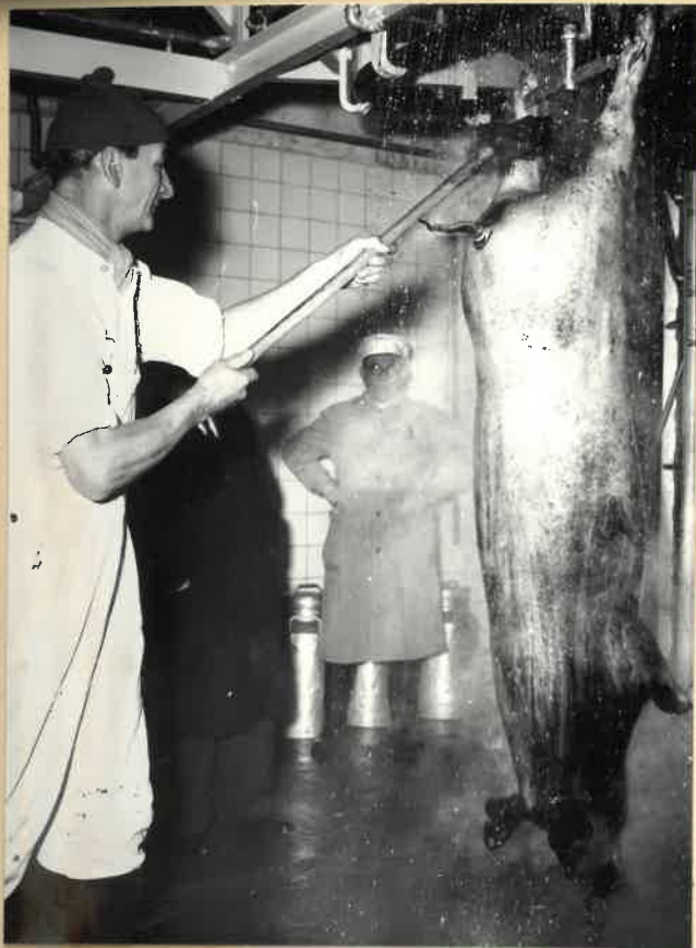
Efter svidningen skrubbes grisen.