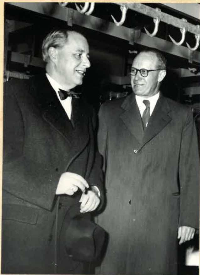
Borgmester og torvedirektør.