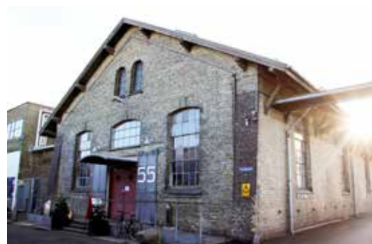
Den Grå Kødby