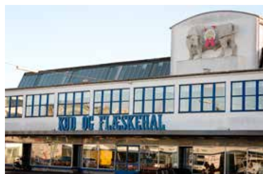
Den Hvide Kødby