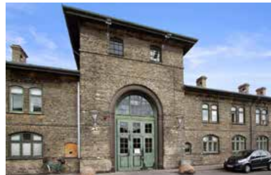
Den Brune Kødby

Den Brune og Den Hvide Kødby er i dag fredet og hele Kødbyen er udnævnt til ét af Danmarks 25 nationale industrimindef.