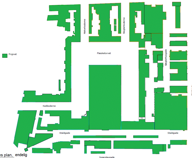
Frigivelses plan, endelig