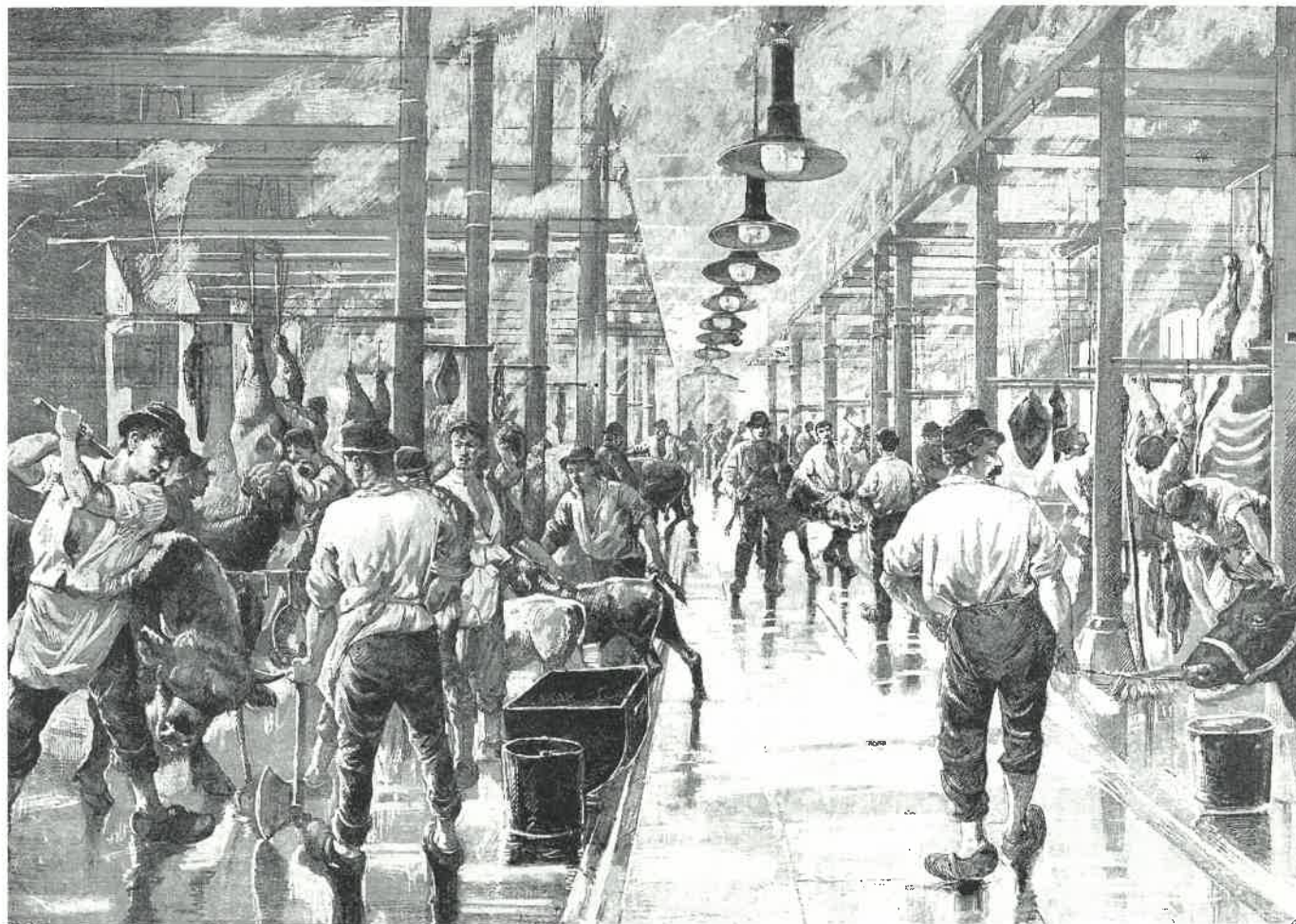
Knud Gamborgs tegning hedder »I en af slagtehallerne ved Kvægtorvet« og er fra 1889. – Illustreret Tidende 16. Juni 1889, Det Kongelige Bibliotek.

pe blev solgt i Flæskehallen, som den til daglig blev kaldt. Blandt de få kvinder, der var ansat af Torvevæsenet, var mange ansat i laboratoriet og ledte efter trikiner blandt grise. ■ Lene Skodborg